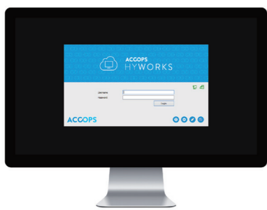
電源をONにするとログイン画面が自動起動します。Accops HyDeskはモニターの背面に取り付けることができます。(VESA規格対応モニター)

Accops HyDeskは、Citrix ICAやVMWare Horizon PCoIPにも対応しています。