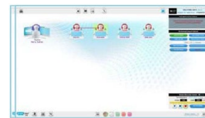
[一斉授業用教員画面]