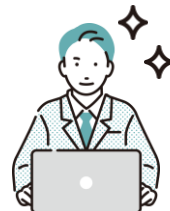
問い合わせ対応者