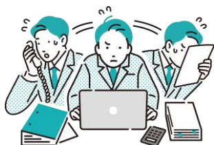
問い合わせ対応者